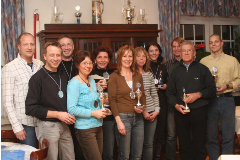
Unsere Vereinsmeister des Jahres 2006